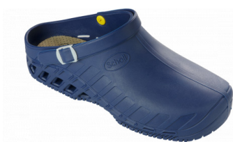
CLOG EVO TPR Blue Professional | Memory Cushion F265631007 | HF | 34/35-46/47 | Large

Grille de Tailles spécifique [34/35]-[46/47] : [34/35] [35/36] [36/37] [37/38] [38/39] [39/40] [40/41] [41/42] [42/43] [43/44] [44/45] [45/46] [46/47]