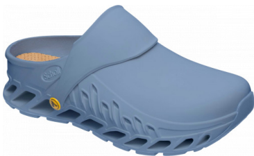
EVOFLEX TPR Glacial Blue Professional | Memory Cushion F293782384 | HF | 35-46 | Large