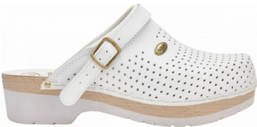
CLOG SUPERCOMFORT B/S Bycast White Professional | General Comfort F323861065 | HF | 35-46 | Large