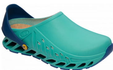
EVOFLEX TPR Emerald/Navy Blue Professional | Memory Cushion F293782295 | HF | 35-46 | Large