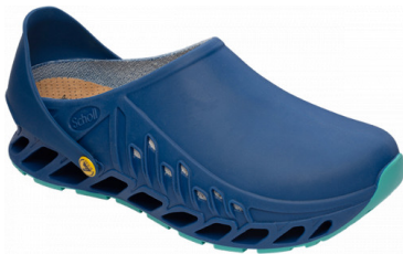
EVOFLEX TPR Navy Blue Professional | Memory Cushion F293781040 | HF | 35-46 | Large