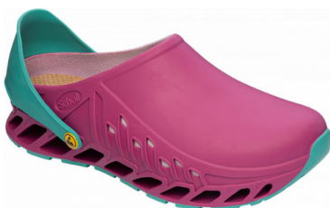
EVOFLEX TPR Fuchsia/Emerald Professional | Memory Cushion F293782296 | HF | 35-46 | Large