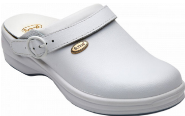
NEW BONUS Unpunched Bycast White Professional | General Comfort F219021065 | HF | 35-46 | Large