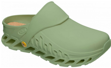
EVOFLEX TPR Sage Professional | Memory Cushion F293781054 | HF | 35-46 | Large