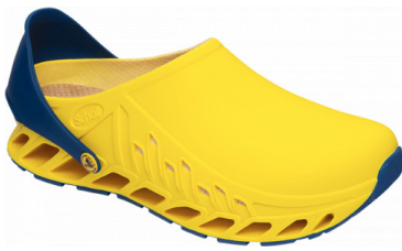
EVOFLEX TPR Yellow/Navy Blue Professional | Memory Cushion F293782297 | HF | 35-46 | Large