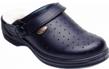
NEW BONUS Punched Bycast Navy Blue Professional | General Comfort F219041040 | HF | 35-46 | Large