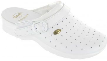
CLOG RACY Bycast White Professional | General Comfort F239271065 | HF | 35-46 | Normal