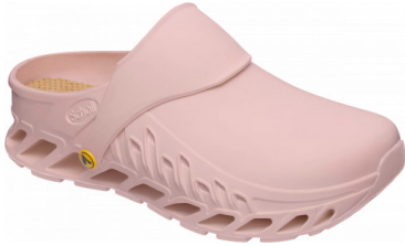
EVOFLEX TPR Pale Pink Professional | Memory Cushion F293781248 | HF | 35-46 | Large