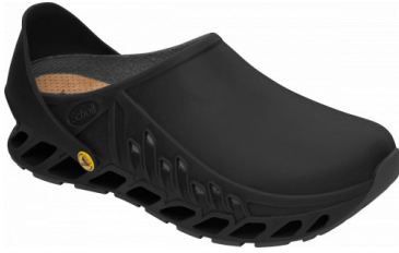
EVOFLEX TPR Black Professional | Memory Cushion F293781004 | HF | 35-46 | Large