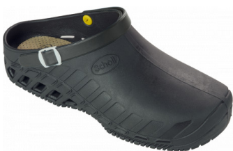
CLOG EVO TPR Black Professional | Memory Cushion F265631004 | HF | 34/35-46/47 | Large

Grille de Tailles spécifique [34/35]-[46/47] : [34/35] [35/36] [36/37] [37/38] [38/39] [39/40] [40/41] [41/42] [42/43] [43/44] [44/45] [45/46] [46/47]