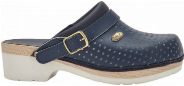
CLOG SUPERCOMFORT B/S Bycast Navy Blue Professional | General Comfort F323861040 | HF | 35-46 | Large