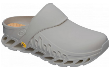
EVOFLEX TPR Stone Grey Professional | Memory Cushion F293782777 | HF | 35-46 | Large