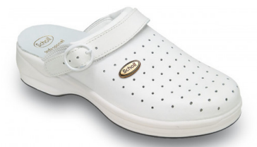
NEW BONUS Punched Bycast White Professional | General Comfort F219041065 | HF | 35-46 | Large