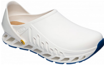
EVOFLEX TPR White Professional | Memory Cushion F293781065 | HF | 35-46 | Large